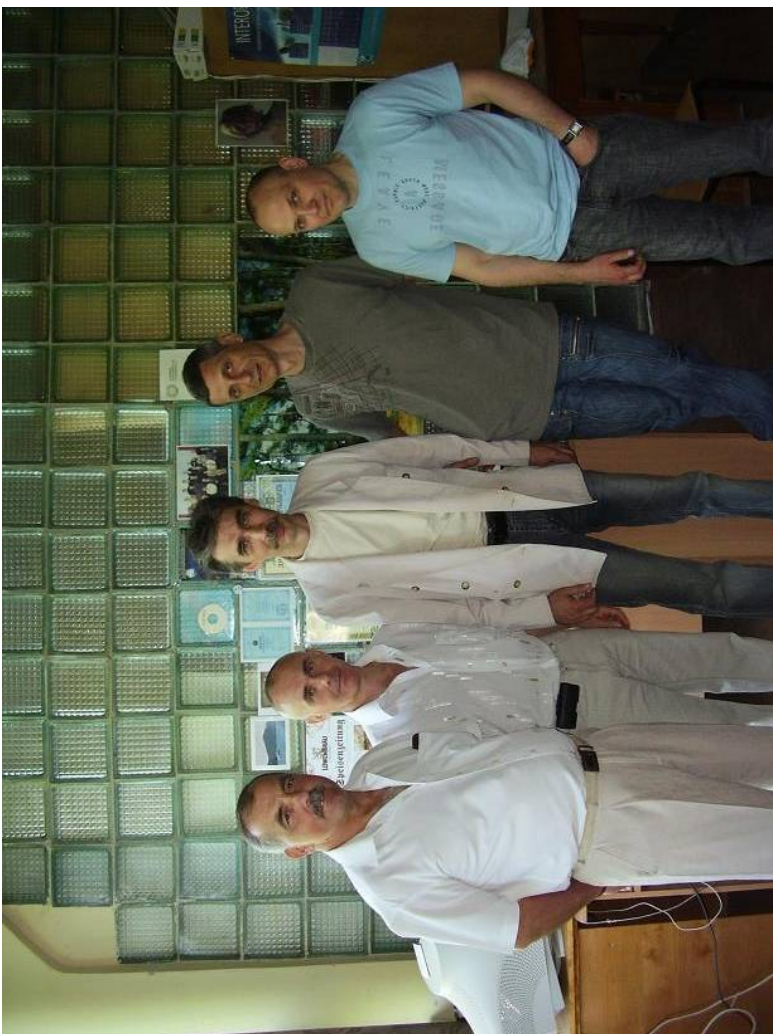
На праздновани Дня ХАИ с одnogруппниками. 2013 г.