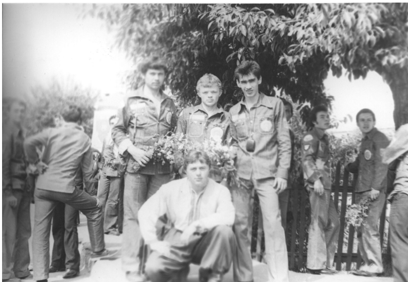
Боец стройотряда «Украина», г. Гагарин, Смоленская область. 1980 г.