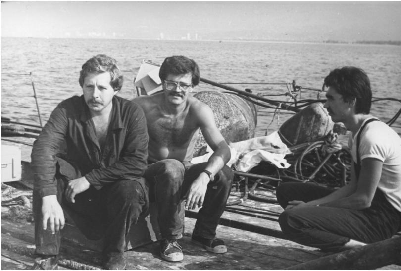
Командировка в Абхазию на натурный эксперимент. 1985 г.