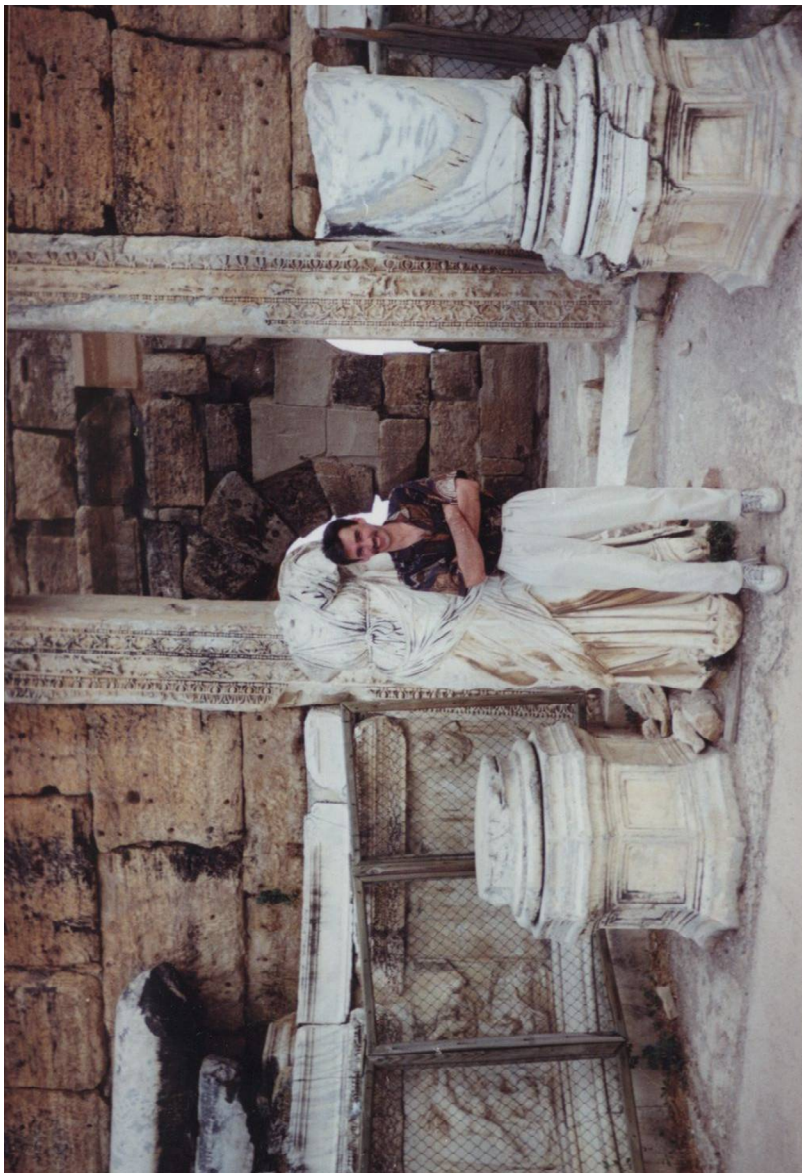
На конференции в Турции. 1999 г.