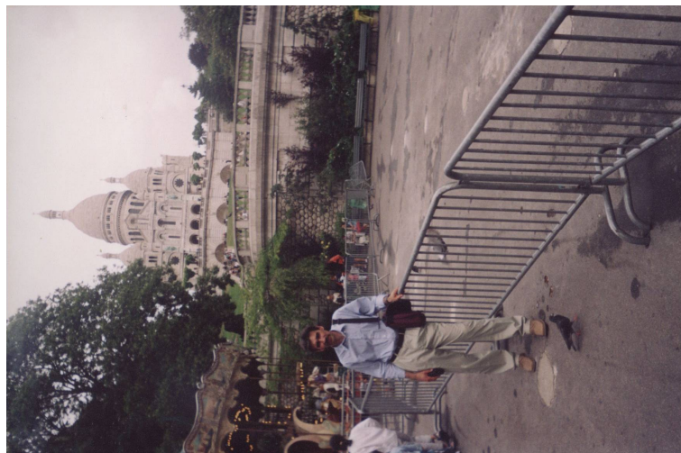
Париж. 2003 г.