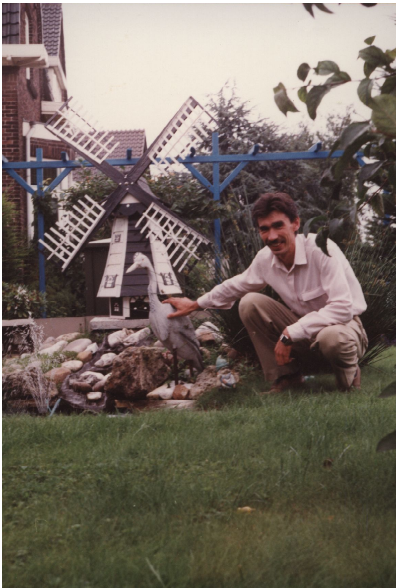
г. Зандворт, Голландия. 1996 г.