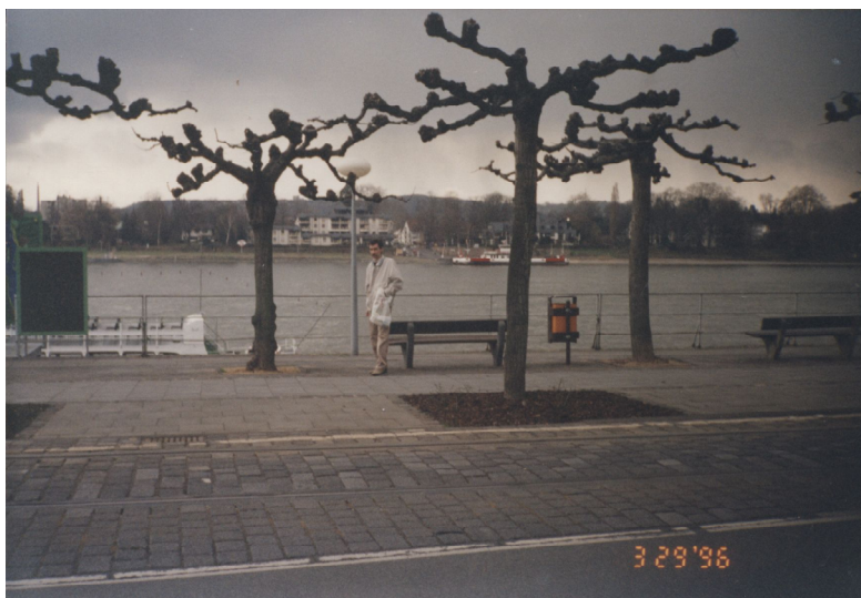
На конференции в Германии, г. Кёнигсвинтер. 1996 г.