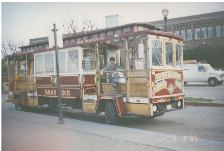
г. Сан-Франциско, США. 1995 г.